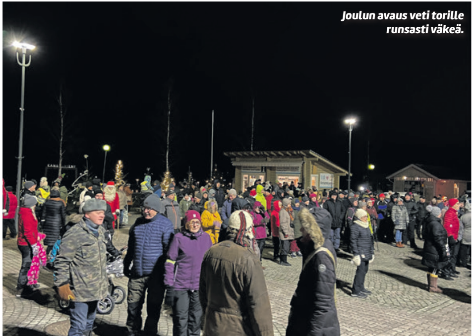
Joulun avaus veti torille runsasti väkeä.