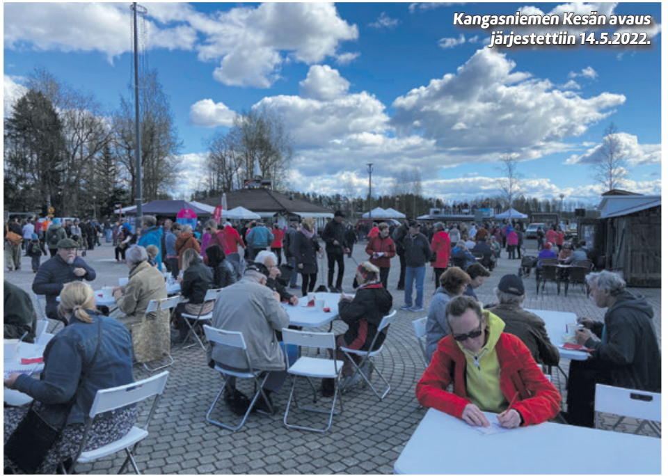
Kangasniemen Kesän avaus järjestettiin 14.5.2022.

Joulun avaus veti viimeisistä kelistä huolimatta torin täydeltä väkeä ja kuuma glögi maistui tapahtumayleisölle.