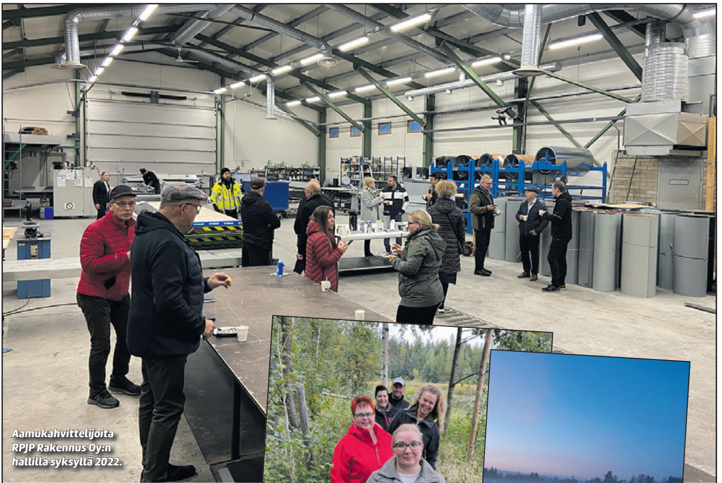
Aamukahvittelijoita RPJP Rakennus Oy:n hallilla syksyllä 2022.